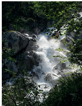
Das Erstfeldertal ist wild. Wild sind auch die Wässer. Im Bild der Alpbach.