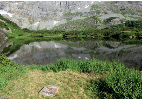
Auf der Wanderung kommt man am Fulensee vorbei, einem Moorsee auf 1700 m ü.M. Bilder: Elsbeth Flüeler

Kröntenhütte SAC, 041 880 01 22 www.kroentenhuette.com