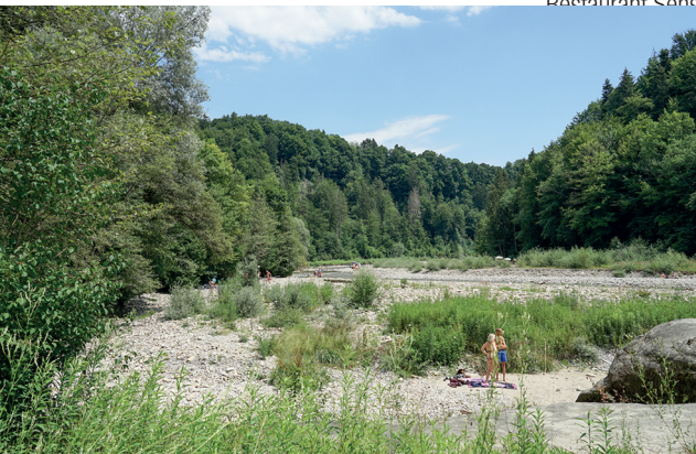
Nach der Mündung in die Sense wird das Tal breiter.

Riesens Rastplatz, Bauernhof-Kiosk kurz nach Hinterfultigen (Krommen), 031 809 35 15 Pizzeria Café SenseMare, Sensematt, 031 889 16 06, www.sensemare.ch Restaurant Sensebach, Sensematt