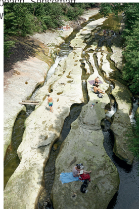
Das Wasser hat pittoreske Spuren hinterlassen.