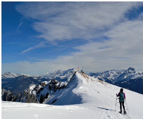
Die Pointe de Bellevue macht ihrem Namen alle Ehre!