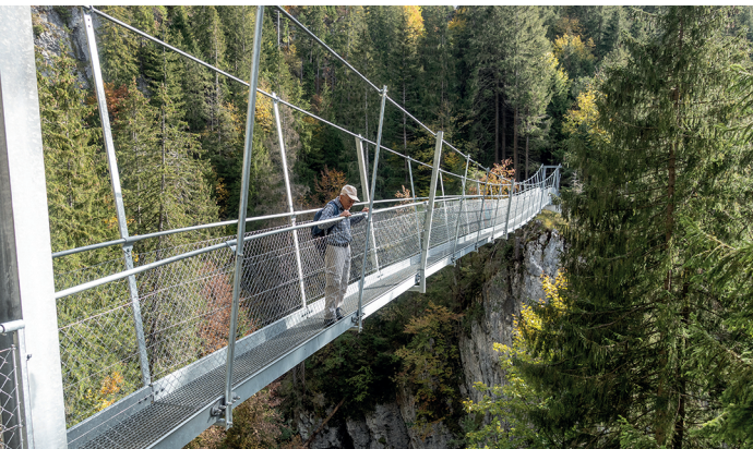
Die neue Hängebrücke beim Chessiloch überwindet erosionsgefährdetes Gelände und bietet attraktive Tiefblicke in die Schlucht.

Hotels und Restaurants in Flühli Alpwirtschaft Glaubenbielen, 041 675 24 71 Alpbeizli Sattelpass, 079 297 42 82