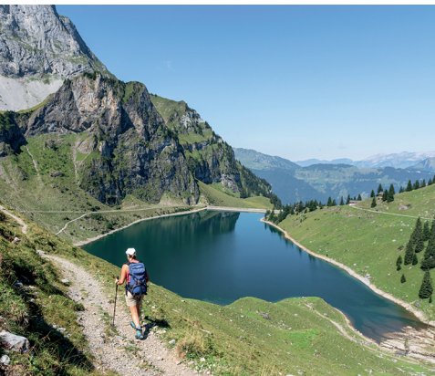
Nach der ersten Steigung zeigt sich der Bannalpsee in seiner vollen Grösse.