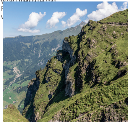
Ganz klein sind Wanderer auf der Kette zu erkennen.