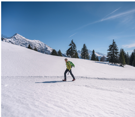
Eine zauberhaft verschneite Landschaft.