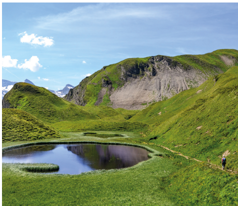
Bei den Seelenen.