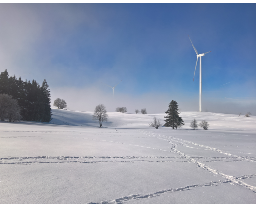
Die Route führt auch an den grazilen Windrädern des Windparks Mont Crosin vorüber.

Funiculaire Saint-Imier-Mont-Soleil, 032 941 25 53, www.funisolaire.ch Hôtel-Restaurant Chalet Mont-Crosin, 032 944 15 64, www.chalet-montcrosin.ch