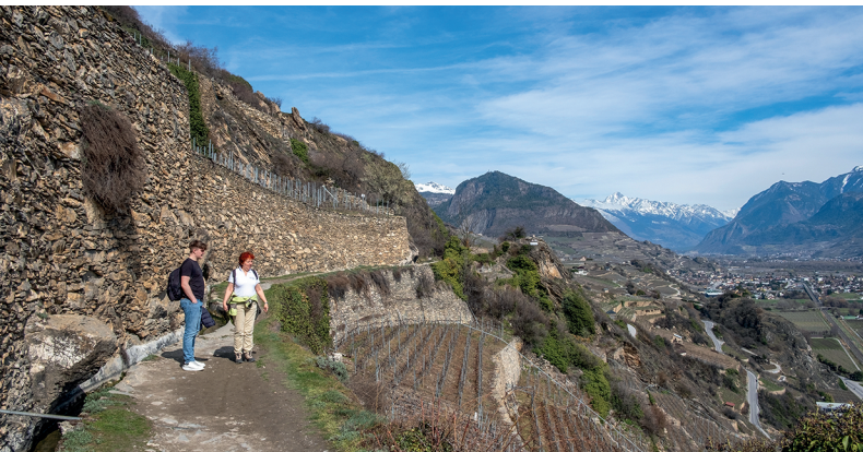
Il sentiero lungo la bisse è costeggiato da muri a secco.