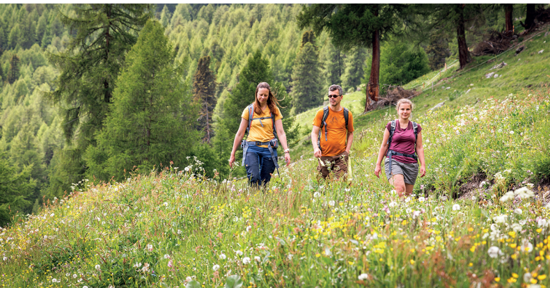
Breve, ma intensa: la primavera in Val Monastero.

Ristorante di montagna Terza, 081 858 71 60, bergrestaurant-terza.ch Monastero Son Jon, Müstair, muestair.ch