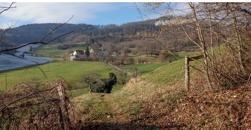
Sehr schön im Winter: die Wanderung zum ehemaligen Kurhotel Bad Schauenburg führt auch über Weiden.

Hotel Bad Schauenburg, 061 906 27 27, www.badschauenburg.ch