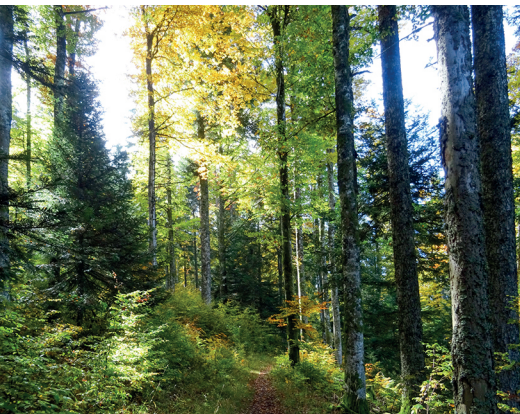
Im Abstieg: Dieser Mischwald ist besser vor Sturmereignissen geschützt als ein reiner Fichtenwald.

Hotel-Restaurant L&#8217;Auberge de Noiraigue, 032 566 13 60, www.aubergedenoiraigue.ch Ferme Restaurant le Soliat, 032 863 31 36 Restaurant les Plânes, 032 863 11 65 Restaurant Café des Mines, 032 864 90 64, www.mines-asphalte.ch