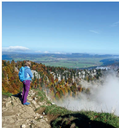
Der Creux du Van, im Hintergrund das Hochtal Vallée des Ponts.