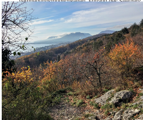
Die Ermitage-Felsen bieten einen Blick auf Neuenburg und den See.