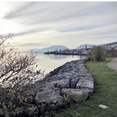
Kurz vor Neuenburg lädt das Ufer zu einem Spaziergang ein.

Neuenburg und Saint-Blaise bieten mehrere Verpflegungsmöglichkeiten. Entlang des Seeufers