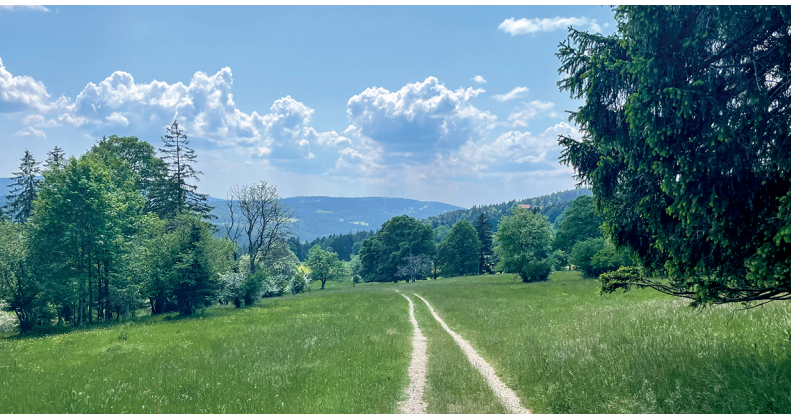
Tipico paesaggio giurassiano: prati, pascoli e boschi radi.

Maison de la Tête de Moine, Bellelay, 032 941 77 77, www.tetedemoine.ch/it/ Auberge de Bellelay, 032 489 52 52, https://adb4u.ch/ Restaurant Arena, Tramelan, 032 487 41 01, https://restaurantarena-tramelan.ch/