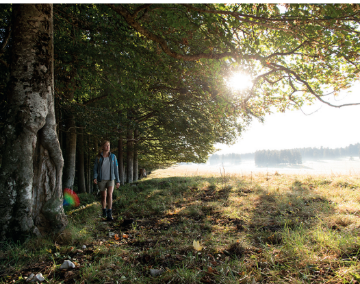
Lumière du matin dans les Franches-Montagnes.

Auberge de la Gare, Le Prépétitjean, 032 955 13 18, www.aubergedelagare.ch Restaurant Les Voyageurs, Le Petit Bois-Derrière, 032 955 11 71, www.voyageursboisderriere.ch Café-restaurant du Sapin, Les Rouges-Terres, 032 951 17 64