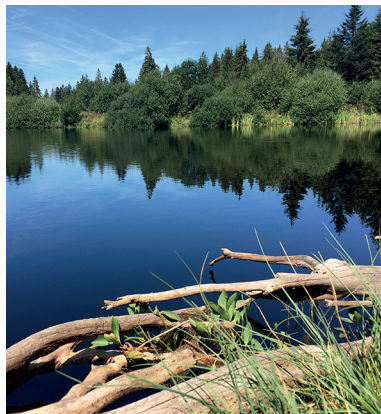
L'étang des Royes est moins fréquenté que celui de la Gruère.