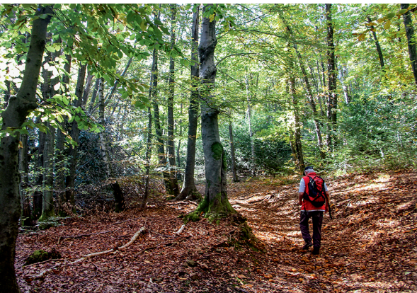
En octobre, de grandes quantités de châtaignes comestibles jonchent le sol.

Ristorante Vetta, Monte San Salvatore, 091 993 26 70, www.montesansalvatore.ch