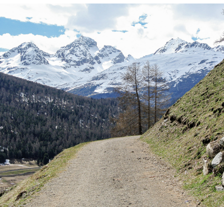
Une impressionnante coulisse de montagne est garantie.

On accède à Pontresina en train via Samedan. Retour avec le funiculaire depuis Muottas Muragl. Un bus relie l'arrêt «Punt Muragl, Talstation» à Pontresina, Samedan et Saint-Moritz. Il y a plusieurs restaurants à Pontresina. Segantinihütte, 079 681 35 37, www.segantinihuette.ch