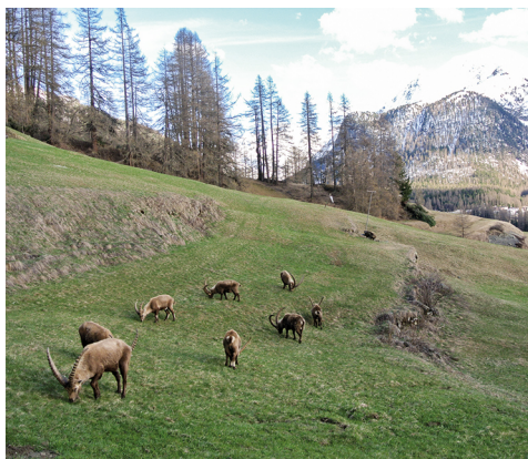
Les bouquetins pâturent calmement et ne se soucient pas des observateurs.