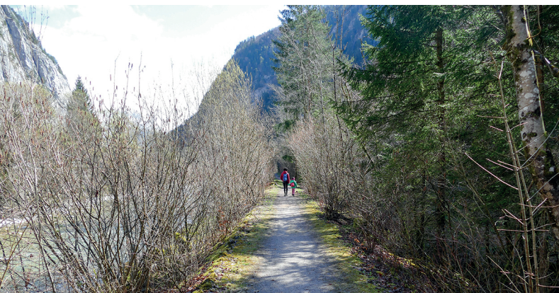
Sur le premier tronçon, le chemin suit la digue de la Simme.

HOF bar & snacks, Oey, 033 681 00 14, www.diemtigtal.ch/gastro/hof-bar-snacks