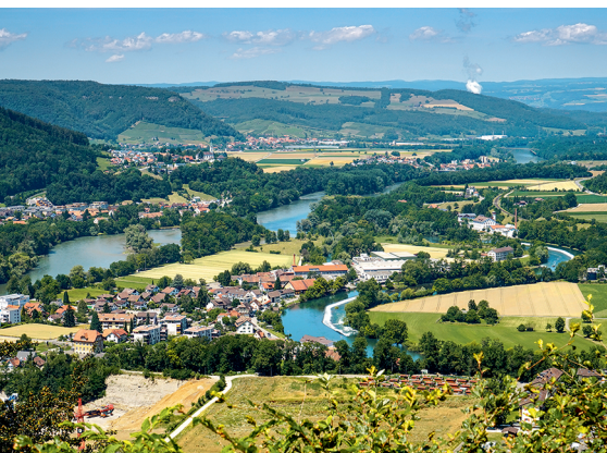
Du Gebenstorfer Horn, vue sur le confluent de l'Aar, la Limmat et la Reuss.

Restaurants et hôtels à Brugg, Windisch, Birmenstorf et Turgi