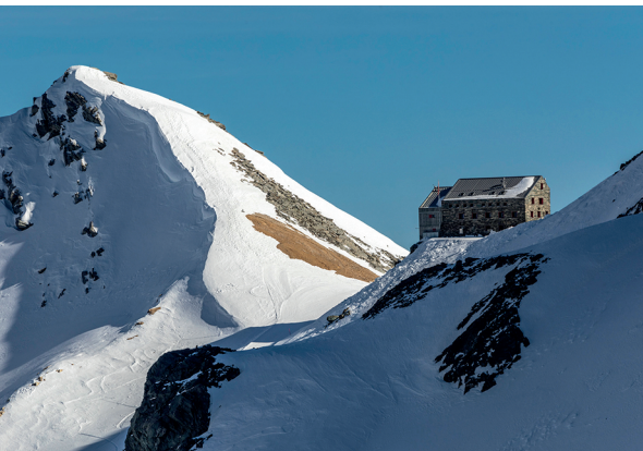
Le sommet de Klein Allalin, à gauche de la cabane Britannia.

Cabane Britannia, 027 957 22 88, www.britannia.ch