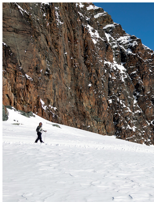
Randonnée hivernale au pied des rochers cuivrés de l'Egginer.