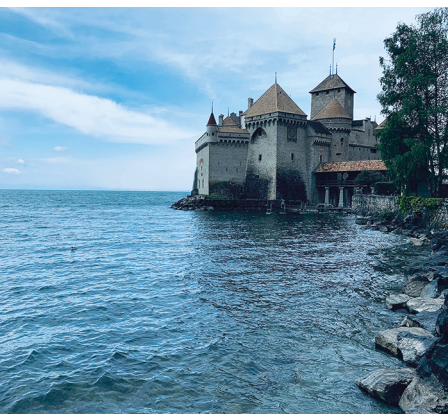
Le château de Chillon, point de départ de la randonnée.

Château de Chillon, 021 966 89 10, www.chillon.ch