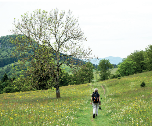
On s'approche de la Tiefmatt en traversant des prairies en fleurs.

Parc naturel de Thal, www.naturparkthal.ch Randonnées soleuroises dans la forêt, www.waldwanderungen.so.ch Restaurant Blüemlismatt, 062 398 14 68, www.bluemlismatt.ch Restaurant Tiefmatt, 062 390 20 60, www.tiefmatt.ch