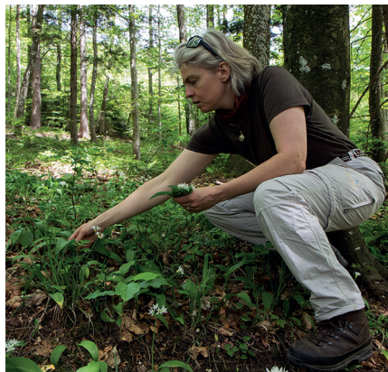
Les plantes sauvages – ici, de l'ail des ours – s'apprennent de toutes sortes de manières.