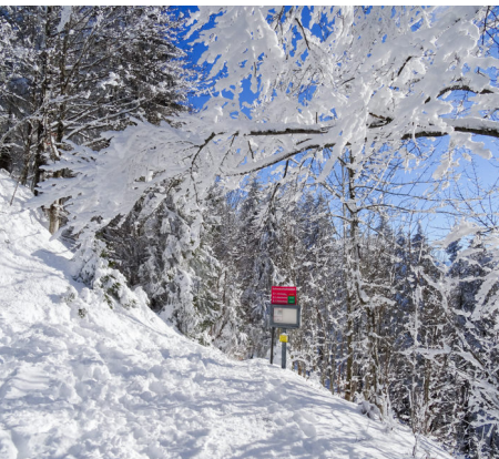
Il faut d'abord se faufiler entre les arbres.