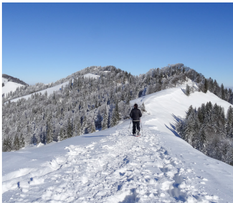
Les deux chemins vont bientôt se séparer.