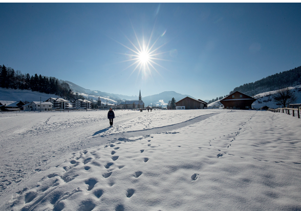
De Rothenthurm, un chemin de randonnée hivernale mène à Steinstoss.

Café Turm, 041 838 15 65, www.cafeturm.ch