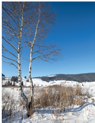
La randonnée passe par le plus vaste haut-marais de Suisse.