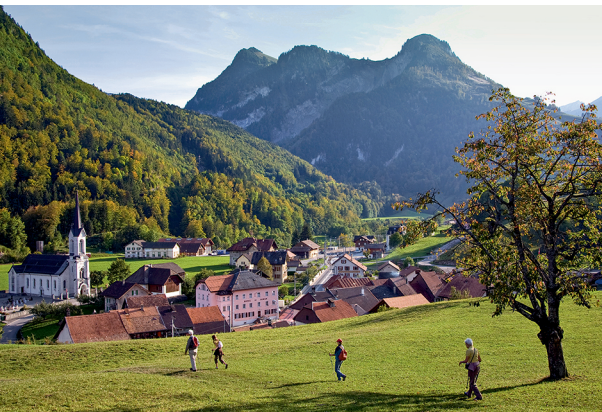
Montbovon avec vue sur la Dent de Corjon.

Allières, hôtel restaurant la Croix de Fer, 026 928 16 06, www.lacroixdeferalallieres.ch Laiterie de Montbovon, produits artisanaux, 026 928 11 43, www.laiterie-montbovon.ch