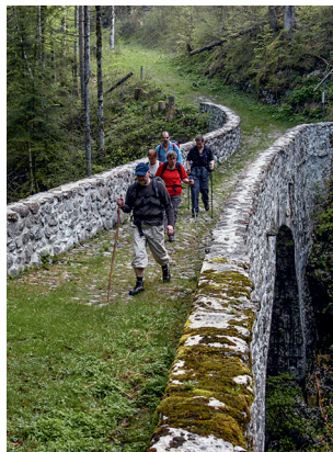
La traversée du Pontet.