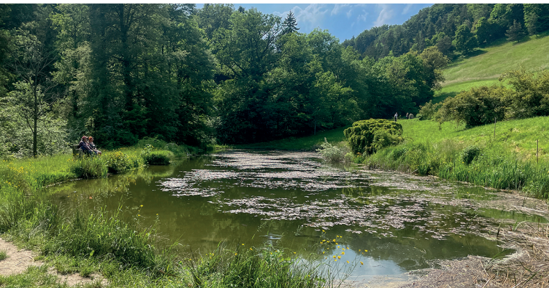
Un banc au bord de l'étang, parfait pour une pause.

Auberge communale de la Croix d'Or, Yens, 021 800 31 08, https://auberge-communale-yens.ch/