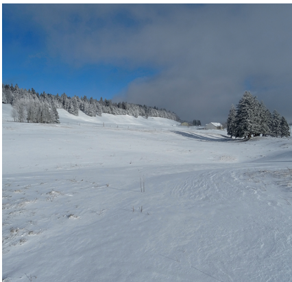
Le haut plateau de la Montagne de Granges est fréquemment en proie à des vents violents.