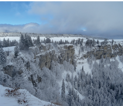
Les impressionnantes parois rocheuses du Wandflue.

Restaurant Obergrenchenberg, 032 652 16 42, erlebnisgrenchenberg.ch