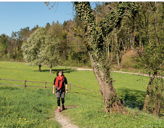
Une partie du chemin fort agréable près de Friedberg.

Restaurant Friedberg, Amlikon, 071 651 12 14, www.restaurant-friedberg.ch V7Bar, au-dessus de Thundorf, 052 376 47 47, www.v7bar.ch