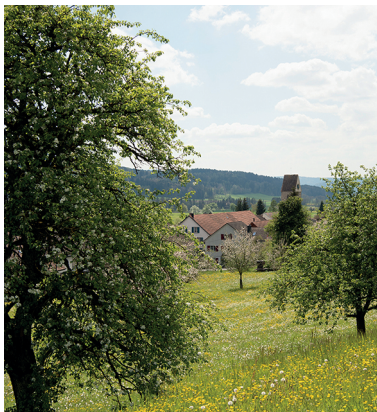
Lustdorf apparaît entre les cimes des arbres.