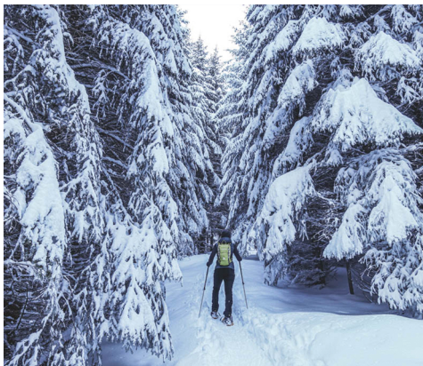
Un conte d'hiver.