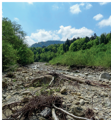
L'Ärgera peut étonnamment gonfler en cas de fortes précipitations.