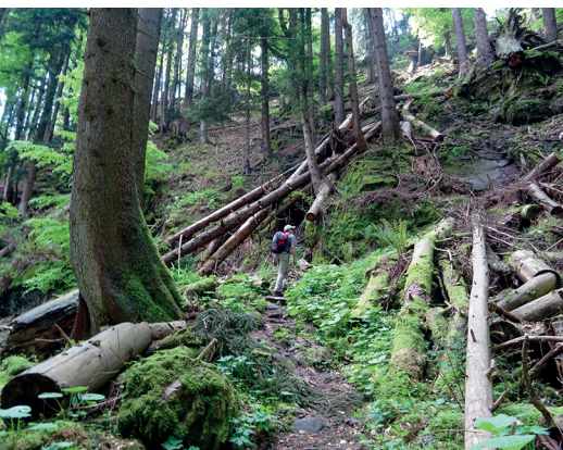
Au pied de la Chrüzflue, le chemin passe près des arbres tombés à la suite d'une tempête.

Restaurant Chemi-Hütta, St. Silvester, 026 418 11 05, www.chemi-huetta.ch Restaurant Edelweiss, Plasselb, 026 419 18 88, www.hotel-restaurant-edelweiss.ch