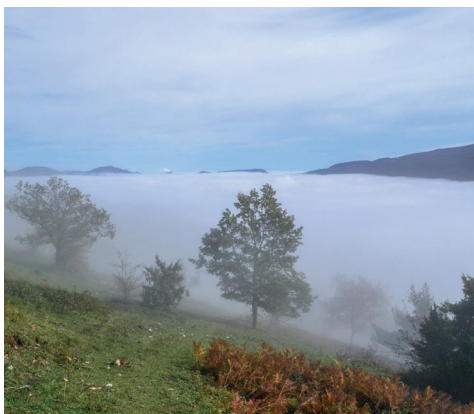
À la frontière entre soleil et brouillard.