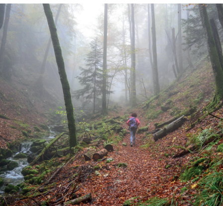
Le bruissement de l'eau est omniprésent.

Auberge Krone, Laupersdorf, 062 391 50 25, www.krone-laupersdorf.ch