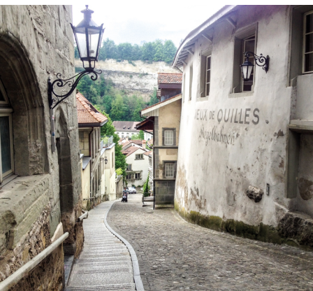
Le point de départ est la vieille ville de Fribourg.

Erreichbar Freiburg mit dem Zug. Von Plaffeien fährt der Bus zurück nach Freiburg.