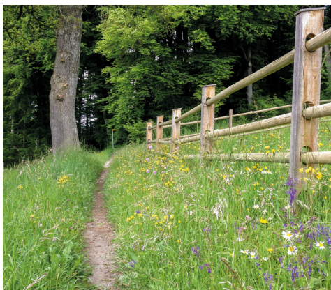
Des prairies fleuries bordent le sentier.