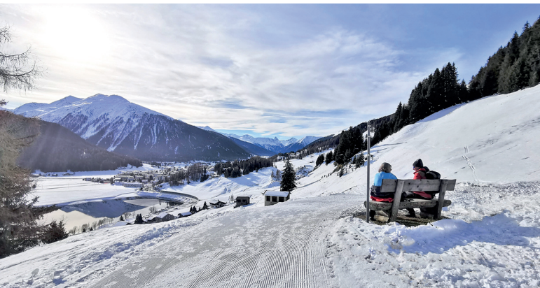
Petite pause au-dessus de Meierhof: vue sur le lac de Davos et le Jakobshorn.

Kesslers Kulm-Hotel, Davos Wolfgang, 081 417 07 07, www.kesslerskulm.ch Restaurant Seehof, Davos Dorf, 081 417 94 44, www.seehofdavos.ch