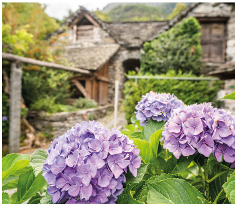
On peut encore admirer les dernières fleurs d'été, juste avant l'arrivée de l'automne.