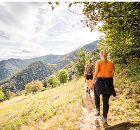
On quitte Rasa dans le sens des aiguilles d'une montre.

On accède à Intragna et Verdasio (station du téléphérique) avec le train des Centovalli qui part de Locarno toutes les 30 minutes. Le téléphérique pour Rasa circule toutes les 20 minutes. Grotto Rasa, 091 798 12 63 Osteria Bordei, 091 780 80 05, www.osteria.bordei.ch