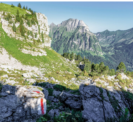
Le chemin de randonnée de montagne est bien indiqué.

Berghotel Obersee (fermé le lundi), 055 612 10 73, www.berghotel-obersee.ch