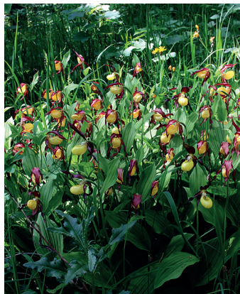
Pendant quelques semaines seulement on peut observer les sabots de Vénus.