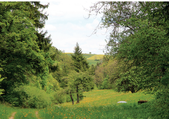
La vallée sauvage et romantique du Müllital.

Gasthof zur Krone, Neuhaus am Randen (D), 0049 7736 523