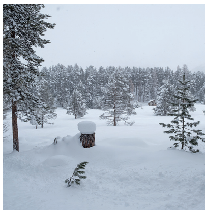
Stazerwald, une forêt absolument idyllique.