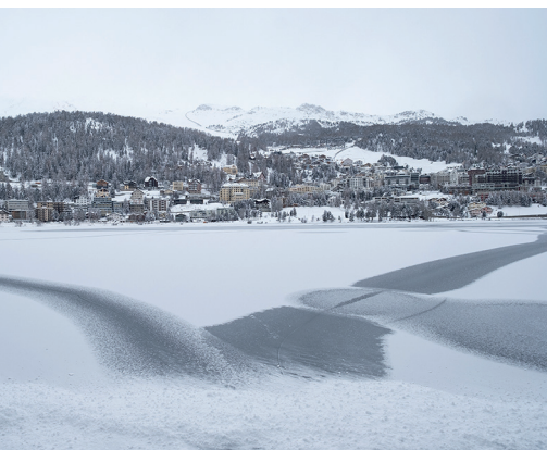
Vue depuis la rive sur le lac gelé et Saint-Moritz.

Cafferino, rive ouest du lac de Saint-Moritz Takeaway Lej da Staz, 081 833 60 50, www.lejdistaz.ch