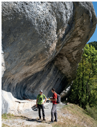
L'abri sous roche de Blanche-Eglise, témoin de milliers d'années d'érosion.