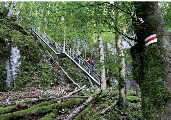
Echelles et escaliers simplifient la remontée vers Le Noirmont.

Restaurant du Theusseret, Goumois, 032 951 14 51, www.letheusseret.blogspot.com Restaurant de la Goule, Le Noirmont, 032 953 11 18, www.restaurantdelagoule.ch