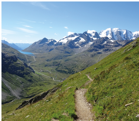
Vue sur le Piz Palü et ses différents sommets, sur le Piz Cambrena à sa gauche et sur le Lago Bianco au niveau du col de la Bernina