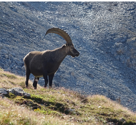
On a de grandes chances d'apercevoir des bouquetins lors de cette randonnée.

On accède à l'Alp Languard en prenant le télésiège à Pontresina. À la gare de Pontresina, on prend le bus local jusqu'à Pontresina, Rondo. On marche ensuite pendant dix minutes jusqu'au télésiège de Languard. Le retour se fait en train ou en bus depuis la gare de Bernina Diavolezza. Restaurant de montagne Alp Languard, tél. 079 719 78 10, www.sporhotel.ch