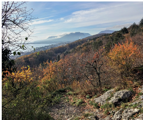
Die Ermitage-Felsen bieten einen Blick auf Neuenburg und den See.