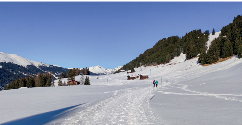
Ab Mittelberg teilen sich Langläuferin und Winterwanderer den Weg.

Langlaufzentrum Parpan, www.langlaufparpan.ch , 079 512 55 68