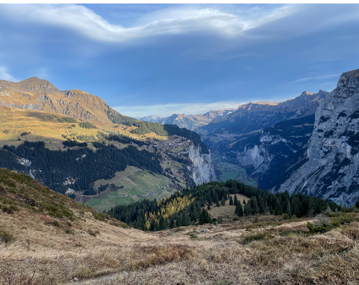
Das Lauterbrunnental und Gimmelwald immer fest im Blick.

Mehrere Restaurants in Gimmelwald Berghotel Obersteinberg, 033 855 20 33, www.stechelberg.ch