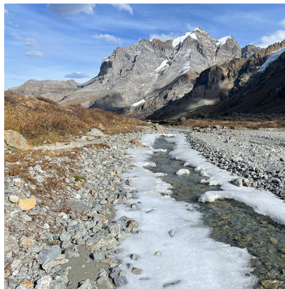
Im Vorfeld des Breithorngletschers beginnt neues Leben.