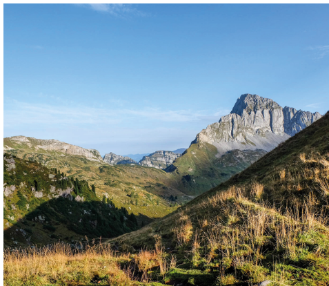
Von der Murgseefurggel aus sieht man zum ersten Mal den Mürtschenstock.