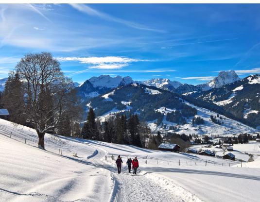
Aussichtreicher Abstieg nach Gruben. Der markante Gipfel rechts ist die Gummfluh.

Erreichbar sind Saanenmöser und Gstaad mit der Bahn ab Zweisimmen bzw. Montreux. Golfhotel Les Hauts de Gstaad, Saanenmöser, 033 748 68 68, www.golfhotel.ch Hotel Bernerhof, Gstaad, 033 748 88 44, www.bernerhof-gstaad.ch