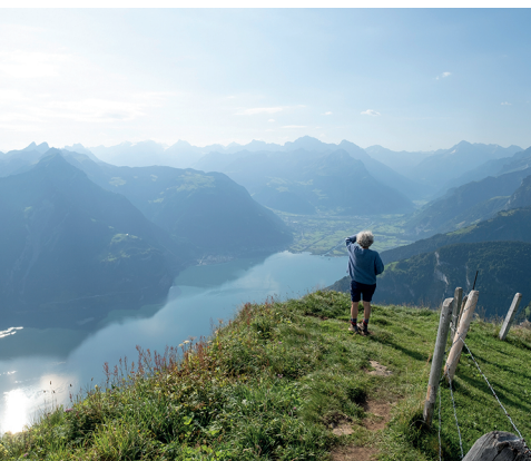
Vom Weg aus geniesst man den Blick auf den Urnersee Richtung Uri.

Berggasthaus Niederbauen, 041 620 23 63, www.berggasthaus-niederbauen.ch Alpeizli Tritt, 079 579 27 60, www.worldofcheese.ch/alp-tritt Berggasthaus Stockhütte, 041 620 53 63, www.stockhuette.ch