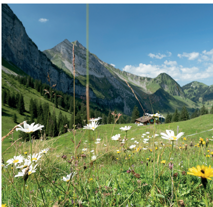
Die Wanderung führt über die Oberbauenalp zum Rinderbüel.