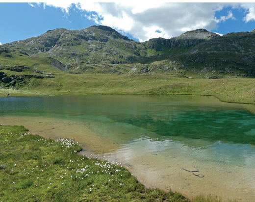
Benannt nach dem wandernden Mönch: der Leg Columban.

www.kolumbansweg.ch Hotel Stampa, Casaccia, 081 824 31 62, www.hotelstampa.ch Hotel Post, Bivio, 081 659 10 00, www.hotelpost-bivio.ch