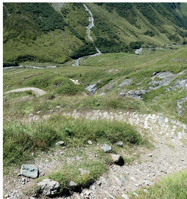
Breite Säumerwege machen den Aufstieg auf den Septimerpass angenehm.