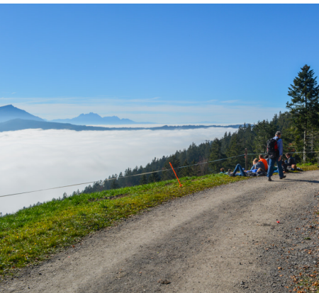
Rast über dem Nebelmeer mit Blick auf die Rigi und den Pilatus.

Restaurant Raten, Montag Ruhetag, 041 750 22 50, www.restaurant-raten.ch