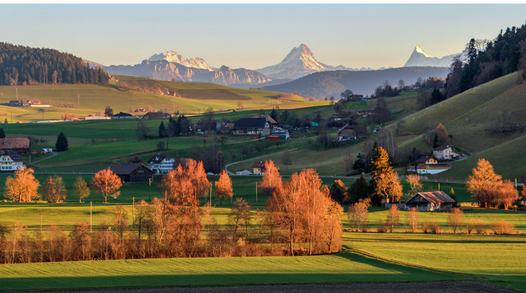
Toller Blick über die hügelige Landschaft in die Berner Hochalpen mit Wetterhorn, Schreckhorn und Finsteraarhorn.

Sensorium Rütthubelbad, 031 700 85 85, www.sensorium.ch Restaurant Rütthubelbad, 031 700 81 81, www.ruettihubelbad.ch