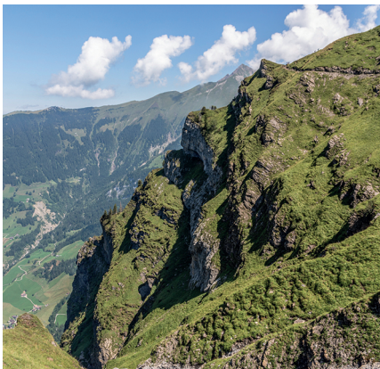
Ganz klein sind Wanderer auf der Kette zu erkennen.