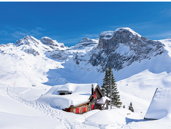
Von der Chrühütte ist es nicht mehr weit bis zur Luftseilbahn.

Berggasthaus Urnerstaffel, 041 628 15 75, www.urnerstaffel.com